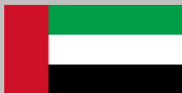
Emiratos Árabes Unidos