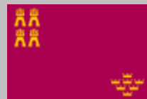
Región de Murcia