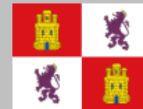
Castilla y León