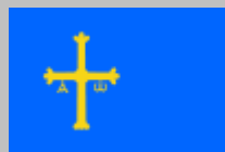
Principado de Asturias