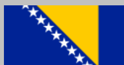
Bosnia y Herzegovina